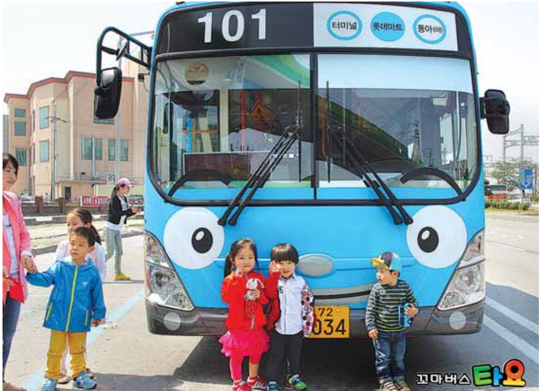
© ICONIX / OCON / EBS / SKbroadband